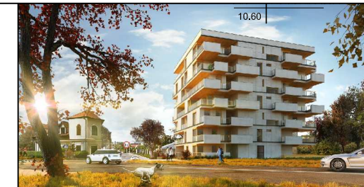
parter lokalizacja mieszkania