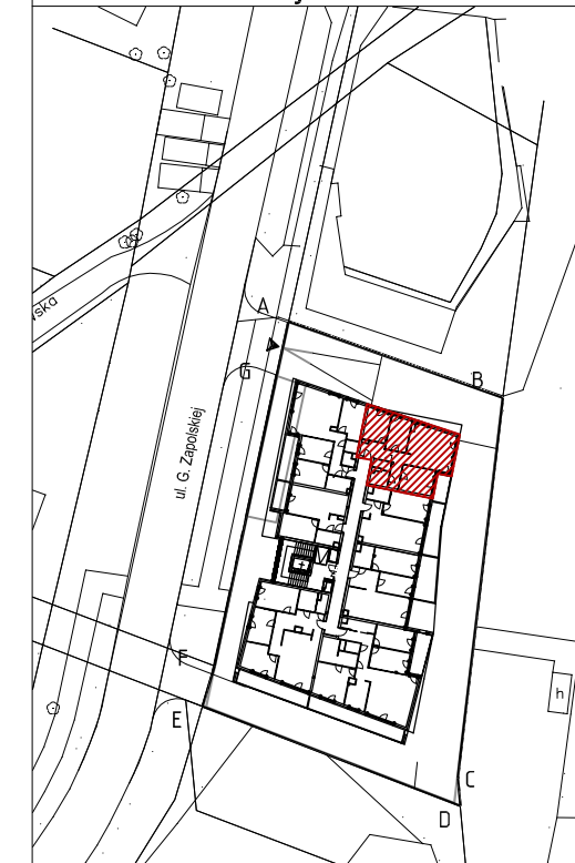
Mieszkanie nr 28